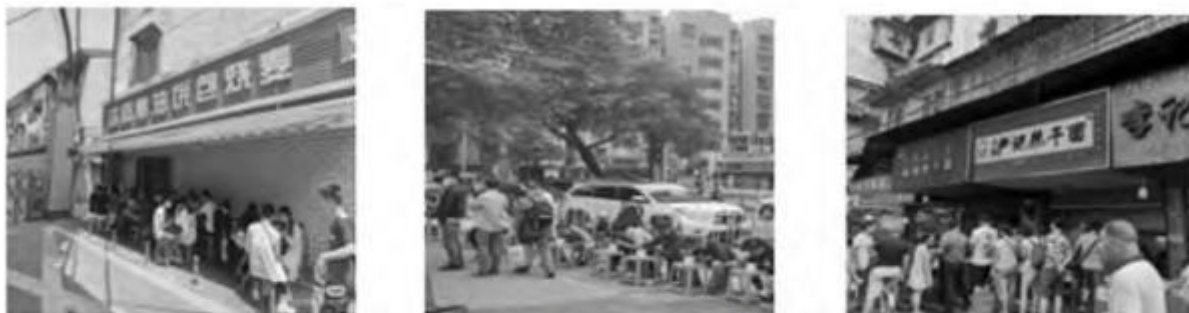
图 4 疫情前武汉居民过早的情景