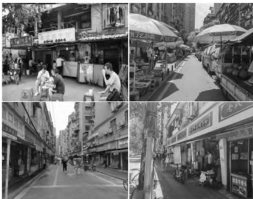
图 5 疫情后武汉居民过早的情景