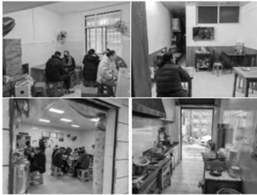
图2 社区早餐店内部特征

根据调查显示,武汉主要所经营的早餐类型主要分为面食,煎炸、烤烙、煮蒸等多个类型,大多数私人门店面积为15-50m 2 ,可是面对众多类型小吃门店的存在,其室内空间类型大体一致,门前以制作区和收银区为主,表现为开敞式结构特征,就餐区位于门店内,结构形式过于单一。