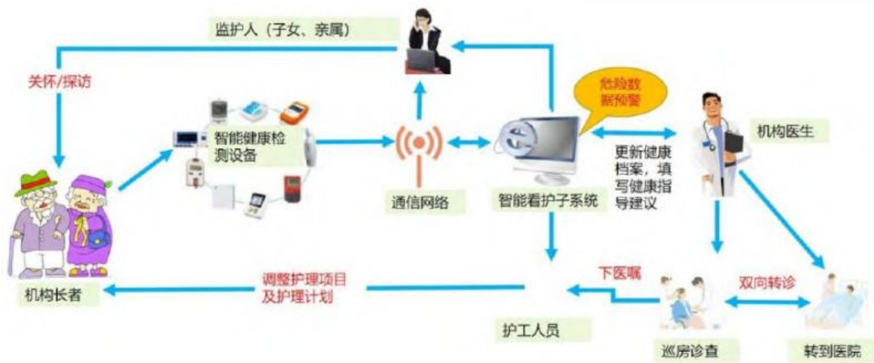
图2 农村养老服务综合信息平台