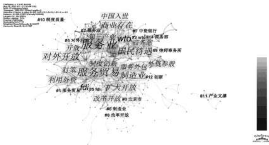
图 2 1992—2021 年“服务业开放”文献关键词共现网络与聚类分析

将 CiteSpace 软件中“关键词”的阈值(Threshold)设置为 10,得到如图 2 所示的图谱。对“服务业开放”的文献关键词进行共现分析的结果显示,共包含 559 个节点,875 条连线,连线密度为 0.0056,上述结果表明检测到的关键词的联系较为紧密。其中处于中心地位的关键词包括“服务业”“服务贸易”“对外开放”“扩大开放”和“制造业”等,均与“服务业开放”主题有着直接的联系。