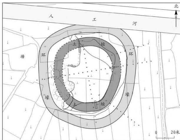
图三//南神墩遗址环壕、土垣平面示意图