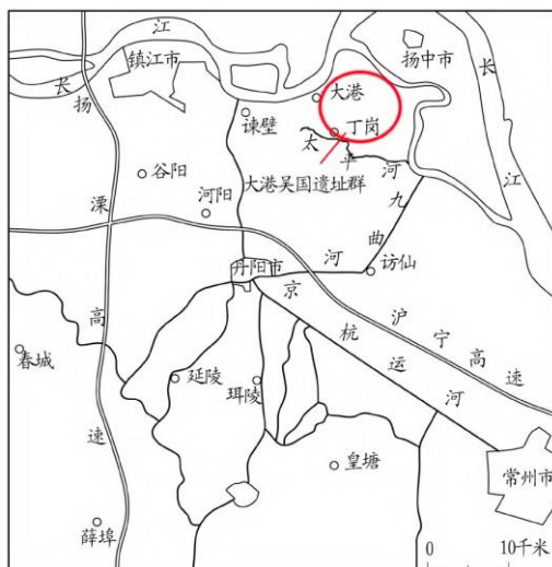
图一//大港吴国遗址群位置图

座西周、春秋时期铜器大墓。有学者考释，母子墩土墩墓主人为周章之子熊遂，北山顶春秋墓主人为吴王余昧，青龙山春秋墓主人为吴王僚 [10] 。至于出土宜侯矢簋的烟墩山，遗址性质、器物年代曾经争议较大，李学勤先生修改了自己原有看法，判明烟墩山当为一座大型土墩墓；他同意唐兰先生观点，即宜侯矢簋为康王时代之器，只是他认为矢是周章之子熊遂 [11] 。不论怎样，烟墩山和母子墩两座土墩墓为西周早期吴王陵已经是学术界的主流观点。除大型墓葬外，大港沿江范围内断山墩 [12] 、左湖 [13] 等遗址的发现及发掘，使得学界初步明确镇江大港沿江地区为吴国境内一处重要区域。