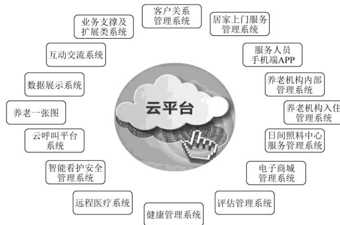
图 2 颐养云平台系统

与一般的机构养老、社区居家养老不同的是，嵌入式养老依靠智能设备、技术，在智慧养老服务平台的基础上，提供智能化的养老服务，这样既可以减少人力资本的投入，又能为老年人提供更加便捷化的服务。智慧养老服务虽然取得了一定成效，但 S 社区长者照护之家的智慧养老服务目前还仅停留在信息查询、远程监控、社区商城等简单易行的服务内容，智慧养老服务的硬件、软件设施还有待提升和完善。一方面，颐养在线服务平台应用系统中一些管理系统，需要政府部门授权，尚未得到开发和应用，如涉及个人隐私的信息数据共享。另一方面，照护中心在提供上门送餐、护理、家政等居家养老服务的同时，并没有建立起相应的居家上门服务管理系统和评估管理系统。