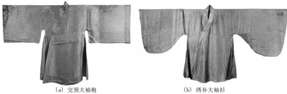
图 3 王店明代李氏墓出土服饰 1

细节进行创新，有了多样化的突破，这种新奇多样的服装形制在王店明代李氏墓出土服饰中得到反映。如出土的折褶大袖袍、圆领袍、交领袍、绣补大袖袍、对襟上衣、绣补大袖衫等服装中，整体上沿承了中国古代服饰交领右衽、衣裳连属、宽衣阔袖的典型特点(图 3),但在形制细节上，不同服装款式其结构、细节各不相同，主要体现在领襟、袖子两个部位。