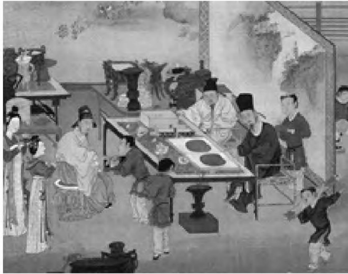
图 2 仇英(明嘉靖年间)竹院品古图

嘉兴王店明代李氏墓是一处四室合葬墓，包括墓主李湘、正妻陈氏及妾徐氏。李湘一脉“世本江阴人。明洪武初，官提举行十四者始迁嘉兴，其后子孙分隶嘉兴、秀水两县籍” [1] 。李氏家族为嘉兴一大望族，明清时期官宦累出，李湘之孙李原中任国子监助教，代表朝廷巡视地方盐务；明天启年间，李湘之孙李衷纯在扬州出任两淮盐御史；清朝康熙五十四年(1715)，李楠曾孙李陈常任两淮盐运使。“以诗书传家”是李氏家族最大的特点，从墓主李湘之子李芳开始李氏家族文人辈出，涌现出众多的诗人和文学家，如顺治、康熙年间，李湘一脉的李良年、李绳远、李符三兄弟被誉为“浙西三李”，李良年与嘉兴一代文宗朱彝尊齐名，合称“朱李”，李良年之后李富孙、李遇孙、李超孙也工诗文而蜚声南北。关于墓葬年代，李湘其妻墓葬出土大统历记有“嘉靖二十二年”(1543)，墓志铭记陈氏卒于万历十七年(1589)，嘉靖、万历年间正是明代中期向后期服饰转型的变革过渡期。该墓发现于2006年，古墓保存较为完整，出土文物有丝织品、铜镜、帽饰、腰牌、墓志铭、文献等，其中最具特色的随葬品属丝织服饰，包括绸袍、上衣、衫、裙、裤、袜、帽、鞋、巾等30余件，配套齐全。这些出土服饰形制多样、织纹精致、图案丰富，是研究明代嘉兴地区丝织业发展和明代服饰特点的珍贵资料，一定程度上代表了嘉兴地区乃至明代织造业的发展水平，展现了明代社会转型期官宦士绅阶层服饰的历史真迹。