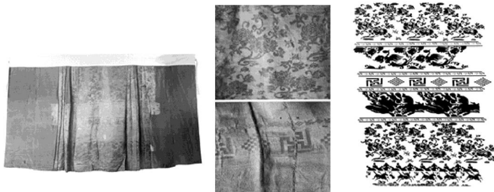
图6 折枝凤凰麒麟奔马纹

鹤纹绸残片中，四合如意云纹主体造型上饱满圆润，沿承传统、追求创新，与仙鹤纹组合构成服装面料的织造底纹，并以四方连续形式进行排列，形成重复的节奏韵律，表现出简约且均衡的视觉效果。在明万历折枝凤凰麒麟奔马织金缎裙的织物纹样中，由折枝花卉、凤凰、麒麟、奔马、“卍”字、人物等多种题材构成丰富的主题纹样，通过对图案进行合理排列，构成饱满且具有故事性的二方连续纹样，在视觉上实现了次序感和丰满华丽的艺术效果(图6)。王店明代李氏墓纹样布局的程式化和充实均衡的特点，印证了明代图案艺术的成熟和社会审美世俗化、求奢趋异的时代风尚。