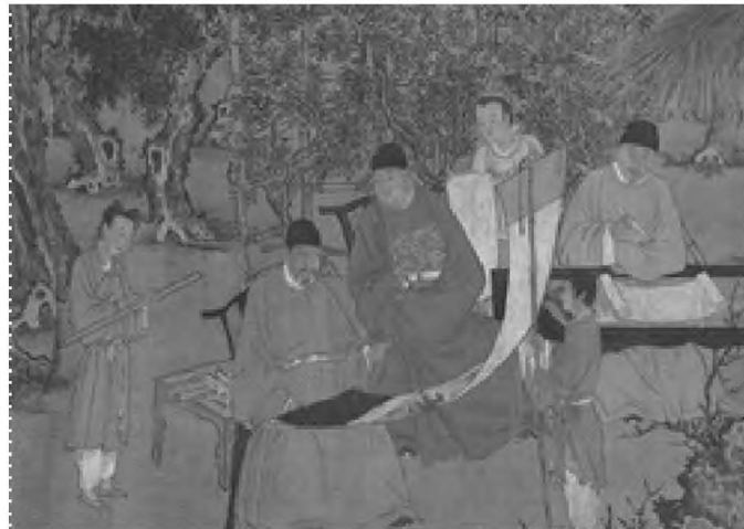
图 1 明正统二年(1437)杏园雅集图

明代作为古代服饰文化发展重要的朝代, 服饰制度“上采周汉、下取唐宋”, 在继承先制的基础上, 凝练升华不断创新, 成为中国近世服饰艺术的典范。明代中后期由于中央集权衰弱, 商品经济活跃, 社会观念转变, 服饰审美由明初的朴实无华和整齐划一逐渐向新奇和多样性转变, 形成逾礼越制、尚奢竞靡、追新逐异的服饰潮流。如图 1 所示, 明初官员团领袍衫承唐制, 服装款式趋于一致, 而明嘉靖年间服饰求新逐异现象突出, 文人雅士着装虽然都为袍衫制, 但服饰在衣领、衣身、帽形等处不尽相同(图 2)。嘉兴王店明代李氏墓出土服饰正值明代中晚期, 其服饰形态大体能反映当时的时代特点。