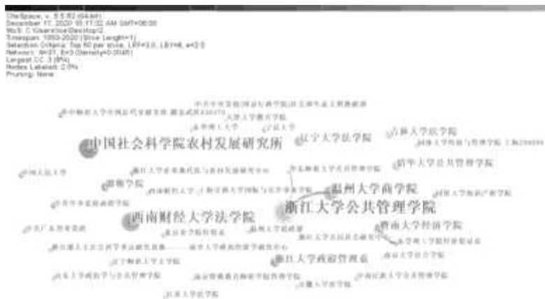
图 3 行业协会研究核心机构共现图

研究机构发文数量与合作网络的可视化分析,有助于我们了解行业协会领域主要研究机构及其研究水平,帮助明确各机构间合作关系。结果显示(见图 3),浙江大学公共管理学院(9 次)、中国社会科学院农村发展研究所(7 次)、西南财经大学法学院(7 次)、温州大学商学院(6 次)出现次数均超过 5 次,表明这些机构是国内行业协会研究的重要阵地。值得注意的是,与作者共现图谱相似,图中节点虽然较多,但是机构之间的连线非常少,颜色淡且强度弱,节点总体呈现“点状”,分布松散而非“网络”。这说明国内学术机构(包括学者)对行业协会的研究倾向于独立进行,为数不多的研究合作主要生发于机构内部,跨机构或跨地区的合作较少,尚未形成紧密、多点联系的合作网络,仅存在以浙江大学公管院为核心、温州大学商学院和华东师范大学公管院为两翼且发文量较高的合作链。从研究机构分布看,研究力量主要分布在浙、川、京等地,虽然其他地区机构也开展了一定研究,但研究机构分布相对分散;在研究对象层面,国内学者主要是对粤、浙两地行业协会展开实证分析,鲜有文章以中西部地区行业协会为研究对象进行探讨,这与粤、浙两地经济相对发达和经济类社团发展较为迅速有直接联系。此外,高校中行业协会研究成果较为丰富的二级学院主要为经济学院、法学院和公共管理学院,这种学院特征与文献学科特征有一定匹配。