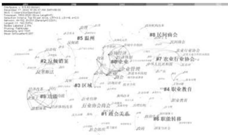
图4 我国行业协会研究关键词共现聚类图谱

关键词是文章内容的高度凝练,常能够反映研究领域与内容的精髓,而通过挖掘、提炼和共现网络分析则能够得到某一领域已有文献的关注热点和主题类别。因此,本文进行关键词共现分析并得到聚类图谱(如图4)。通常,对于聚类的显著性和效果可以从模块值(Q值)和平均轮廓值(S值)两个指标进行分析;其中,Q在[0,1]区间内,当 Q > 0.3 则划分出来的社团结构是显著的,当S值 > 0.5 时,聚类效果是合理的 (6) 。基于图4,Q值为0.723,S值为0.657,这表明本研究聚类图谱结构显著且效果合理,即行业协会研究主题较为集中;关键词以行业协会为核心,向周边发散,字体越大代表出现频次越多,行业协会、行业组织、同业公会、企业、市场经济、政府、经济体制、行业协会商会、反倾销、职业教育、农产品行业协会、会员、反垄断法、治理、WTO、功能、行业自律、社会组织、农产品、中华人民共和国等词出现10次以上,为高频关键词,能够较好地反映行业协会研究热点;聚类编号越小说明聚类规模越大,企业、政会关系、反倾销案、区域、职业教育、温州、职能转移、农业行业协会、民间商会、功能是依据关键词形成的十大聚类,较好地反映了研究主题。为了简化并突出主题,本研究结合高频关键词与每一子聚类具体内容,进一步对研究内容进行聚类并发现国内行业协会研究主要有如下四大热点。