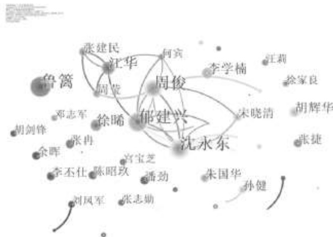
图2 行业协会研究核心作者共现图

在学科分类层面,国内行业协会研究的学科分布较为广泛,涉及人文社科类多个学科,但不均衡现象比较突出。其中,经济学科独占鳌头,发文量占比约五成,涉及国民经济、农业经济和工业经济等多个领域,这与其经济类社团的组织类属具有直接联系;管理学(主要为工商管理与公共管理)和法学学科发文量分列二、三,分占总量的14%和12%;其他学科如社会学、教育学、政治学发文量较小且均在5%以下。其中,管理学视角的研究多聚焦在政会关系、职能定位、社会管理体制、企业发展等主题,法学视角的研究则主要就自治权、反垄断法等组织化“私序”相生的法律问题进行了深入探讨。