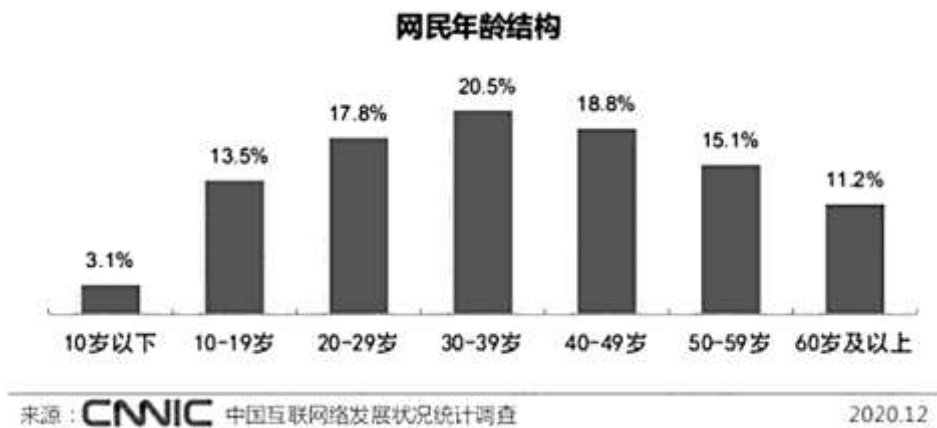
图 1 据 2020 年中国互联网络发展状况统计调查

随着网民数量的逐年增长，网络舆情成了相关部门加强和创新社会管理的重要内容，曾有一项网络调查显示：有 87.9% 的网民非常关注网络监督，当遇到社会反面案例和现象的时候，有将近 93.3% 的网民选择网络曝光。特别是近几年来，我国社会整体上已经进入综合国力高速发展的黄金期，突发事件热点事件频发，其网络舆情也异常高涨，特比是在如今的新媒体时代，新媒体平台发展如此迅速的情况下，各种平台的助推使得网络舆情显现出了强有力的网络效应，公众通过网络较强的传播力，渗透力以及影响力，充分发挥网络平台自有的互动功能，利用其身份的隐藏性，扩大舆情的影响范围，加剧了热点问题舆情的温度，有时候，一点普通的社会问题往往因为舆论的过度发酵，导致舆情一边倒，出现了普通问题政治化，简单现象复杂化的趋势，这对于社会主义和谐社会的建设是一种挑战。