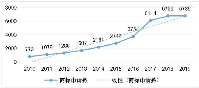
图 1 2010-2019 年湖北省农业类商标申请数

体现出湖北省涉农企业对于品牌建设的重视，也体现了涉农企业家们卓越的创新精神。虽然商标申请总数在不断地增加，但是在全国当中具有竞争力影响力的强势商标品牌较少，大多数农业类商标品牌，特别是近来新注册的，品牌差异化不明显，创新性不突出，部分品牌的影响力仅仅停留在湖北地区。同时，具有区域特色的商标品牌创新带动能力不足。拥有强势的商标品牌对于一个产业来说很重要，一个产业如果没有知名的商标品牌很难有大的发展。企业也是如此，特别是涉农企业，商标品牌显得尤为重要。就目前看来，涉农企业家对强势商标品牌的创新意识不足，没有充分认识到创新强势商标品牌对企业自身、对湖北省甚至于对现代农业发展中的重要作用。