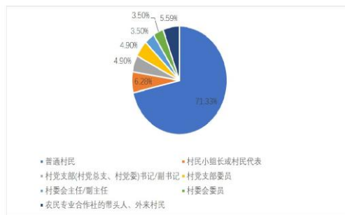
图 2 调研对象职务状况

建立完善治安巡逻防范工作制度，以群防群治组织为依托，落实联户联防、值班站岗机制，建立完善群防群治组织，主要在以村党支部为核心的综治领导小组的带领下、由村委会相互配合；全面加强治安巡逻力度，尤其在重要农时和节日期间，强化了对村道辖区内的治安难点乱点和重点地域的管控力度；建立突发事件预防机制。