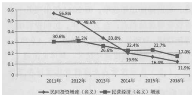
图2: 贵州民间投资增速与民营经济增速比较及弹性系数

投资弹性系数（生产总值增长速度与投资增长速度之比）衡量投资变量的增长幅度对生产总值变量增长幅度的依存关系，具体反映投资增长一个百分点带动经济增长的百分点数。“十二五”以来，贵州民间投资增速与民营经济增加值增速之间的趋势高度一致（见图2），反映民营经济增长对民间投资高度依赖。