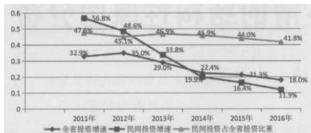
图1: 贵州民间投资与全省全社会投资增速比较及占比图