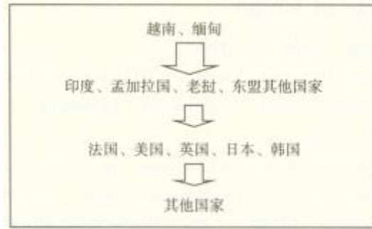
图1 滇桂边境旅游国别推进营销模式

为解决进少出多的问题，应内联外拓，突出自然风光和边贸特色向国外联合宣传，积极吸引国外游客来华旅游。按照国别推进模式，有层次的向外推销（如图1）。同时，在国内按照地区推进模式，有重点地进行宣传（如图2）。