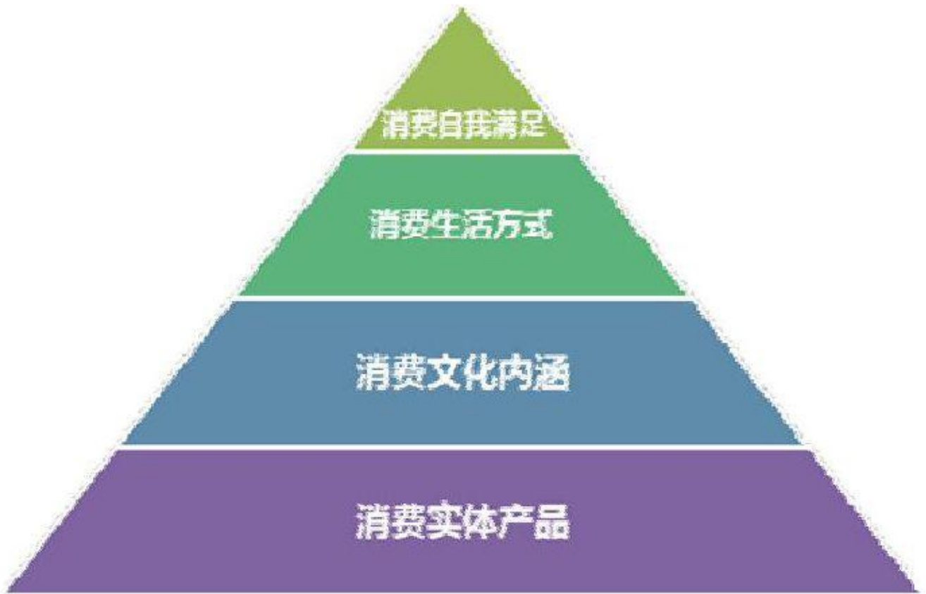
图 2 都市文化消费路径的升级

田子坊的“仿”古与“创”新告诉我们田子坊的成功不在于其对古老一成不变的眷恋，亦不在于其破旧立新的从零开始，而是在于其融合的巧妙，老弄堂的风情、新商业的生机，传统的文化，全球的聚焦促成了田子坊的文化价值，创造了都市人在文化中的消费潮流，以及在文化消费路径上的升级与变迁。